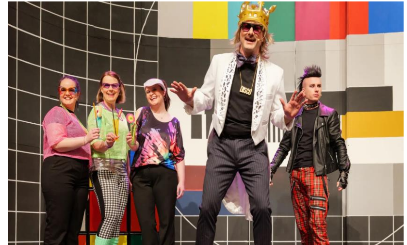
NT Delmenhorst "Völlig losgelöst" Ensemble