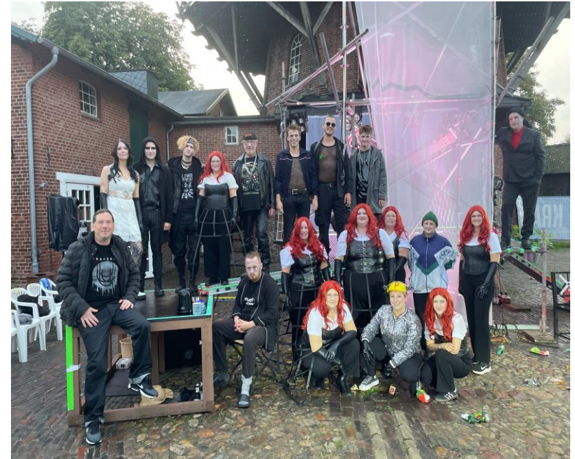
NDB Nordenham "Krabat" Ensemble