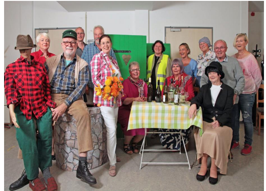
NDB Cuxhaven "Wellness, Wien un wilde Wittfruuns" Ensemble