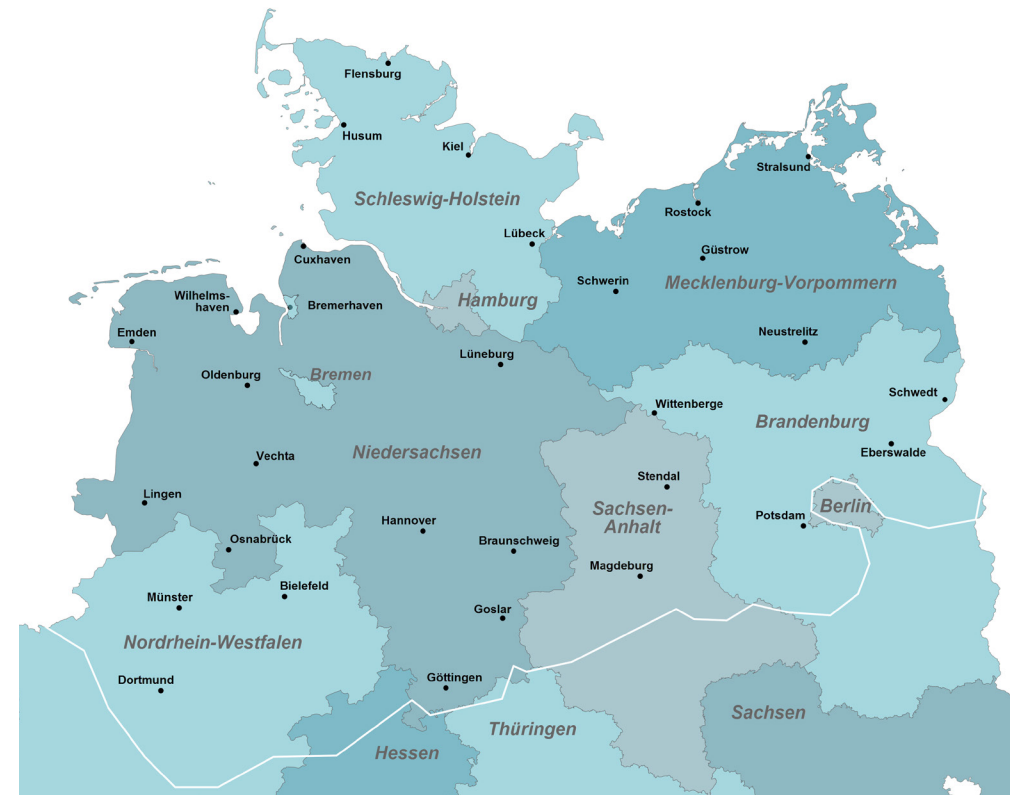
Abb.1: Der niederdeutsche Sprachraum (Karte erstellt mit www.regionalsprache.de )

Die diesjährige Erhebung wird von der Forschungsgruppe Wahlen als repräsentative Telefonumfrage durchgeführt. Insgesamt werden ca. 1.600 Personen aus den oben genannten acht Bundesländern befragt. Ein großer Teil der Fragen orientiert sich an denen der repräsentativen Gesamterhebung des Niederdeutschen von 2007 und an der deutschlandweiten Spracheinstellungsstudie des IDS und der Universität Mannheim von 2008. Durch die Fortschreibung gleicher Fragenkomplexe lassen sich mögliche Entwicklungen und Tendenzen aufzeigen.